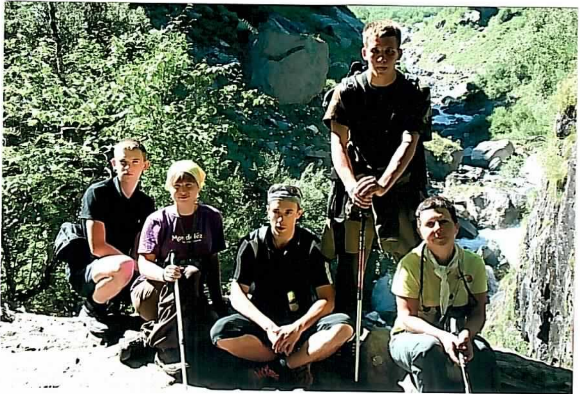
ур. Чёртова Мельница, долина р. Амангуз