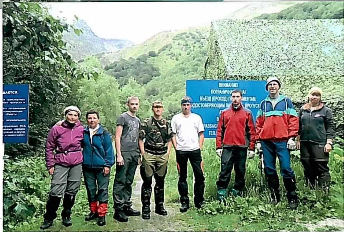
п/о у А/л Алибек