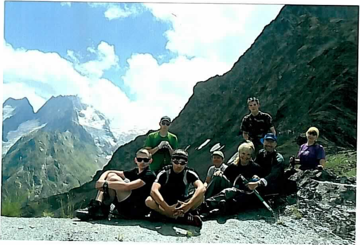
пер. Чучхур (н/к, 2700)